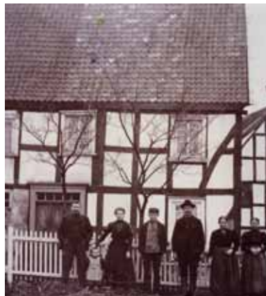
Oberveischer- straße 36