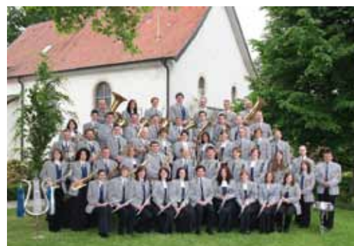
Musikverein „Harmonie“ Balzhofen