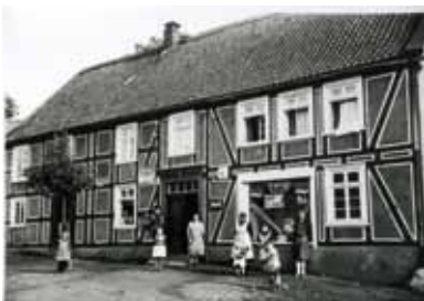
Oberveischer- straße 44