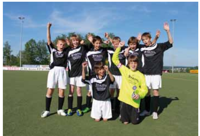
... der Nachwuchs