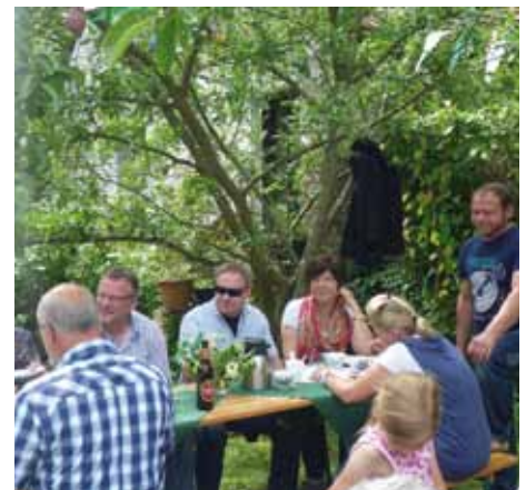
Ausflug der Königskompanie nach Köln