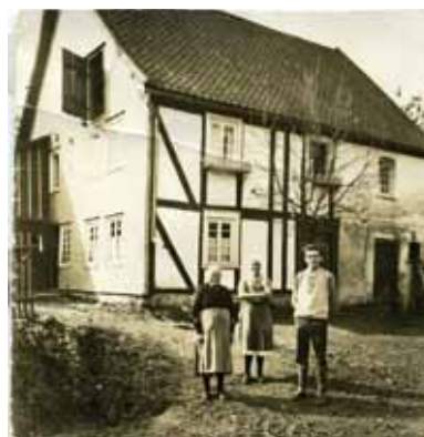
Oberveischer- straße 22