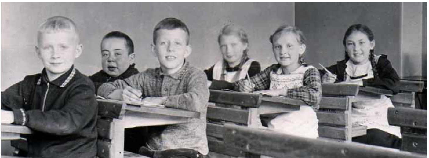
Klassenfoto um 1930