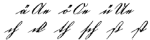
Kurrentschrift um 1865