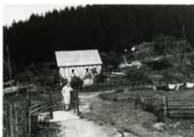
Am Knapp 4