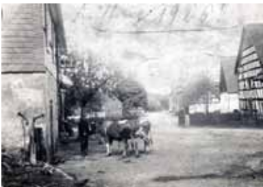
Im Eck - 1926